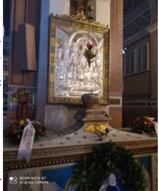
Η Λάρνακα του Αγίου Γρηγορίου Ε΄ Πατριάρχου στον Ι. Μητροπολιτικό Ναό Αθηνών Ευαγγελισμού της Θεοτόκου. Την 10 η Απριλίου 2021 με την συμμετοχή εκπροσώπων της Ο.Ο.Μ.Κ.ω. και της Αδελφότητας Δημητσανιτών εψάλη Δέηση.

Με την άνοδο του Προκοπίου στον πατριαρχικό θρόνο της Κωνσταντινούπολης το 1784, ο Γρηγόριος εξελέγη μητροπολίτης Σμύρνης, διαδεχόμενος τον Προκόπιο στην ιστορική αυτή μητρόπολη. Μέλημά του ως μητροπολίτης Σμύρνης, σημειώνει ο Κωνσταντίνος Οικονόμος, να ευαρεστήσει με τη ποιμαντική του δράση τον Θεό. Ανεγείρει μεγαλοπρεπείς ναούς και τους καθιστά κέντρα προσευχής και λατρείας σε μια δύσκολη για τον Ελληνισμό