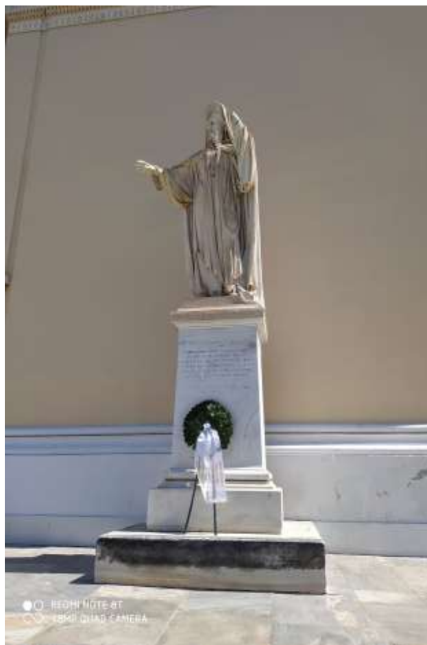
Κατάθεση στεφάνου την 10 η Απριλίου 2021 από την Οι.Ομ.Κω. στον ανδριάντα του Αγίου Γρηγορίου Ε΄ Πατριάρχου Κωνσταντινουπόλεως στα προπύλαια του Εθνικού Καποδιστριακού Παν. Αθηνών

Τους Χριστιανούς ένωνε η πίστη, η οποία σφυρηλατούσε και την εθνική συνείδηση, καθ' όσον η Εκκλησία διεκράτησε την πνευματική ελευθερία των ελευθέρων Ελλήνων, αναζωογόνησε την εθνική παράδοση και κρυφίως η φανερώς ενίσχυε το όραμα της ελευθερίας.